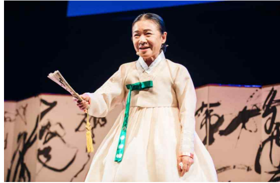
그림 2. 관객과 소통 중인 안숙선 명창